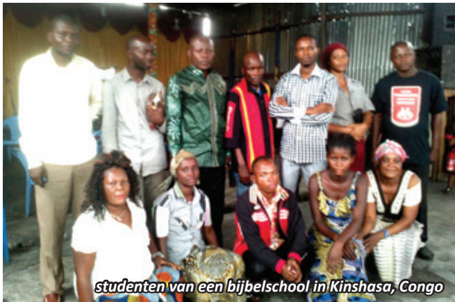
Studenten van een bijbelschool in Kinshasa, Congo

Als christenen weten wij dat de belangrijkste opdracht die de Here Jezus gaf aan zijn kerk was, om alle volken tot zijn discipelen te maken. In Congo, waar ik vandaan kom, is echter de Islam erg in opkomst, vooral in de landelijke gebieden. Daarom is er in de Democratische Republiek Congo een nieuw initiatief gestart met de naam GEBIM. Dat betekent: Grote Internationale Mobiele Bijbelschool. Deze school heeft zijn deuren geopend voor kandidaten die zich geroepen weten om zich te laten scholen tot zendelingen in hun eigen land. Dit om de ver afgelegen landelijke gebieden met het evangelie te bereiken. In het oostelijke deel van het land, bij de stad Goma, is een enorme toename van de islam. Het is hier dat bemoediging en opbouw voor de christenen die daar zijn erg nodig is. De meeste gemeentes zijn in de hoofdstad Kinshasa, maar kom je buiten de hoofdstad, zijn er maar weinig kerken/gemeentes te vinden.