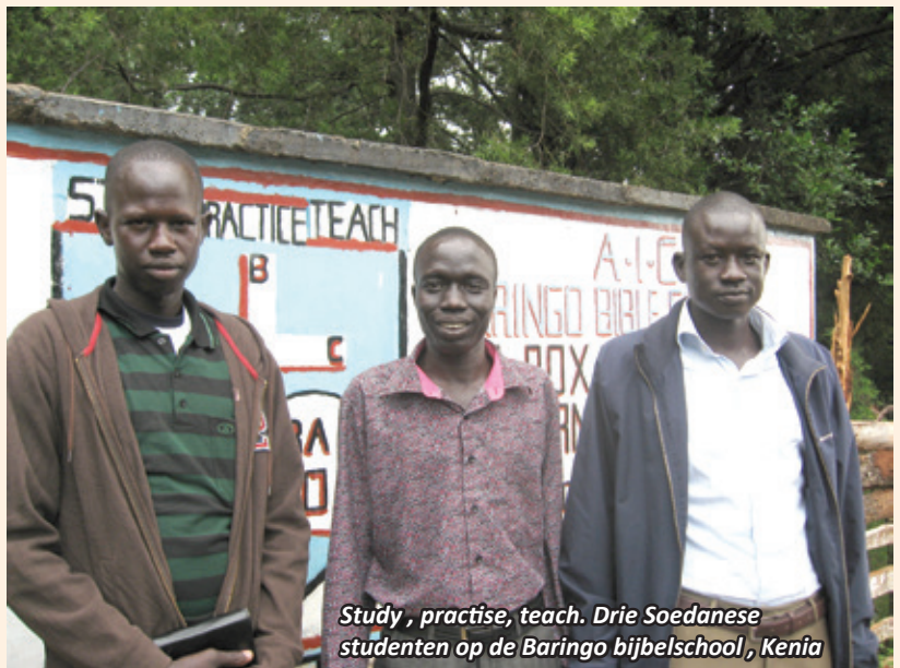
Study, practise, teach. Drie Soedanese studenten op de Baringo bijbelschool, Kenia