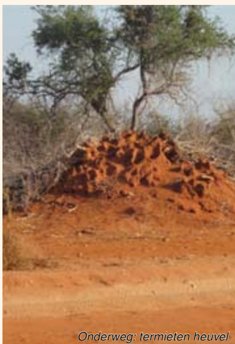
Onderweg: termieten heuvel

Hier in het rijke Westen kunnen we ons nauwelijks een beeld vormen hoe de werkelijke situatie is voor deze medeaardbewoners. Hoe op sociaal, emotioneel en geestelijk vlak er alles aan mankeert. Dat levens metterdaad door elkaar zijn geschud.