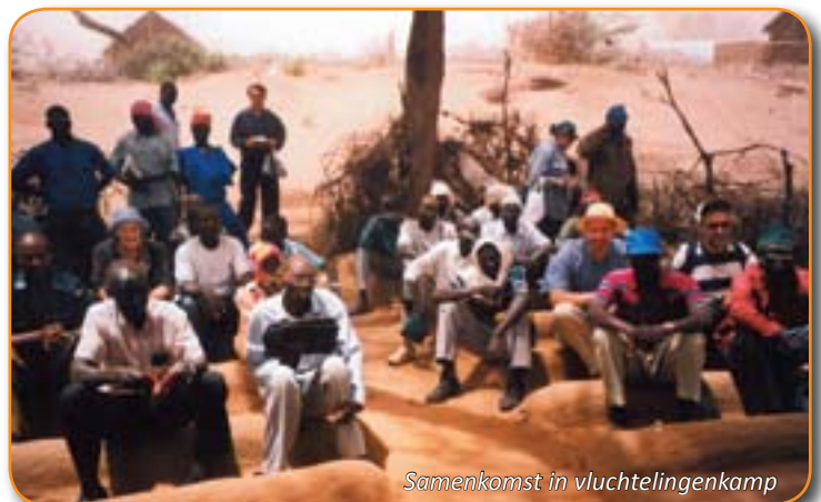
Samenkomst in vluchtelingenkamp