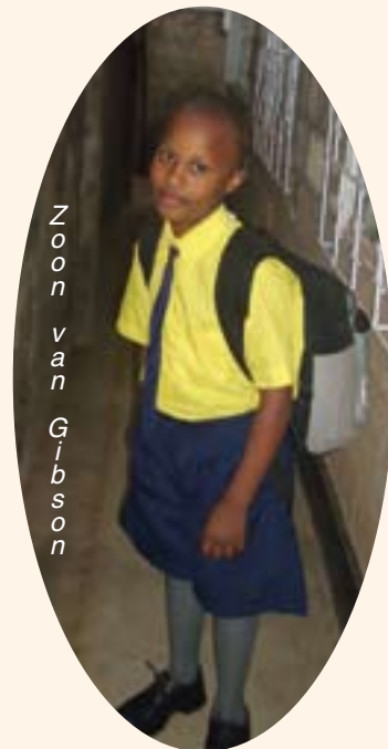
Zoon van Gibson

Het is in Kenia compleet anders dan in ons land. Laten we hopen dat het vertrek uit Kenia niet al te lang op zich laat wachten.